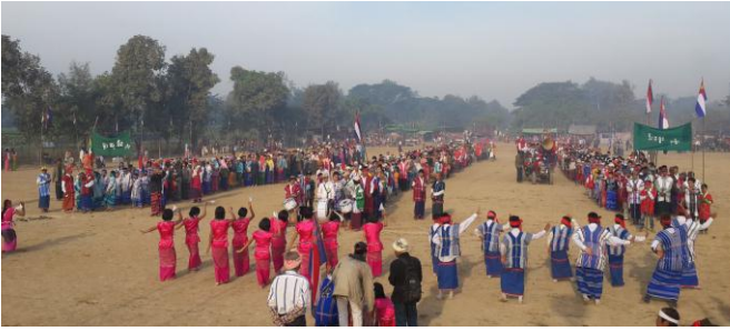
(ပုသိမ်သာသနာ)