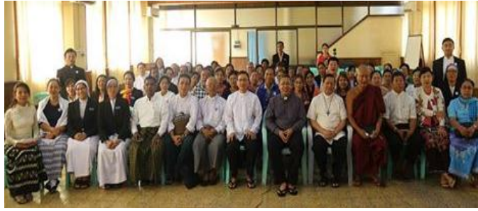
မြန်မာဘာသာသောတရှင်များတွေ့ဆုံပွဲ (ရန်ကုန်)

ထို့နောက်မန္တလေးဗဟိုအကျိုးတော်ဆောင်ရုံးမှ ဘုန်းဘုန်းဘရန်မိုင်မှ RVA အသံလွှင့်အစီအစဉ်များကိုInternetမှဖမ်းယူနားဆင်ပုံအား အကျယ်တဝန်း ရှင်းလင်းပြသခဲ့ပါသည်။ကြွရောက်လာသောသောတရှင်များအား mobile ဖုန်း မဲနိုက်ခြင်းအစီအစဉ်အားပြုလုပ်ပေးခဲ့ပါသည်။ သောတရှင်တစ်ဦးမှ လည်း ယခုလိုကျင်းပပြုလုပ်ပေးသည့်အတွက်ကျေးဇူးတင်ကြောင်း ဗဟုသုတများစွာ ရရှိခဲ့ကြောင်းဝမ်းသာကြောင်းတို့ကိုပြောပြခဲ့ပါသည်။ မန္တလေးအကျိုးတော် ဆောင် ရုံးမှ တာဝန်ခံ sr.စေးဖောက ကျေးဇူးတင်စကား ပြောကြားကာ အစီအစဉ်ကိုအောင်မြင်စွာကျင်းပပြီးစီးခဲ့ပါသည်။ ပင်ကို(၃.၁၂.၂၀၁၅) R.V.A