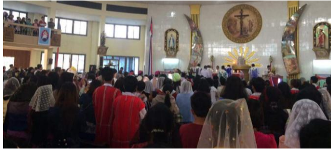
(ရန်ကုန်သာသနာ)